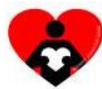
Associazione "Amici del Cuore"